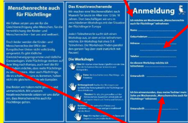
Beispiel eines Flyers

oder eine EMAIL schicken an Beate_Kuhn@gmx.de