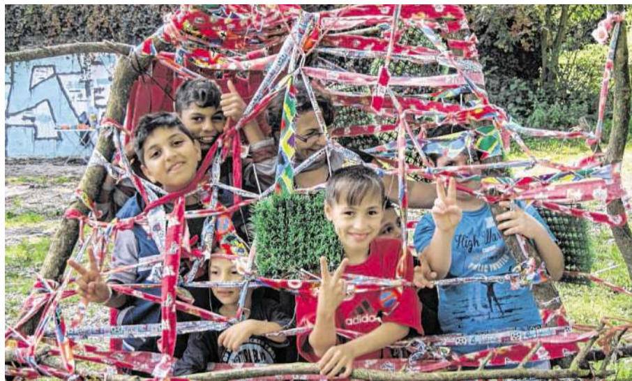
Das Kunstprojekt in der Süsterfeldstraße ist eines der Flüchtlings-Projekte, die von den „Falken“ in der Region gefördert werden.

Einen „warmen Empfang“ für Flüchtlinge und ein möglichst barrierefreien Start in das neue Leben in der Fremde will die Jugendorganisation „Die Falken“ ermöglichen und ist deshalb auch in Aachen aktiv – insbesondere für Flüchtlingskinder. Im Aachener Wohnheim Süsterfeldstraße haben die „Falken“ ein Kunstprojekt unter dem Titel „Weggehen – Ankommen“ gestartet, das mit Mitteln aus dem Bundesprogramm „Kultur macht stark“ gefördert wird. Hierbei beteiligen sich sechs- bis 13-jährige Flüchtlingskinder unter Anleitung von zwei Künstlerinnen an verschiedenen Kunstaktionen. „Die Kinder haben die Gelegenheit, sich künstlerisch auszudrücken, sie erfahren Aufmerksamkeit und Anerkennung, ihre Werke werden am Ende ausgestellt. Und sie kommen in Kontakt mit Einheimischen – den Künstlerinnen, den Aktiven der Falken und anderen – und finden so Zugang